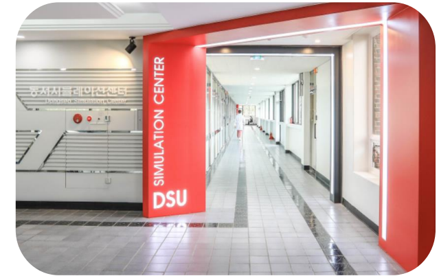
DSU Simulation Center