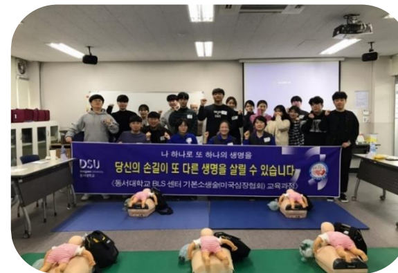
BLS/KALS 센터 운영