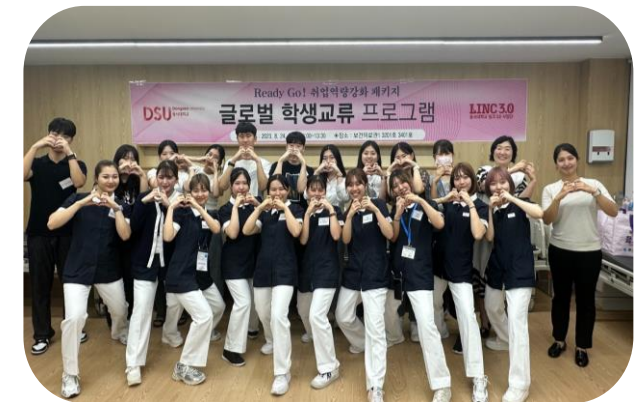
글로벌 학생교류 프로그램